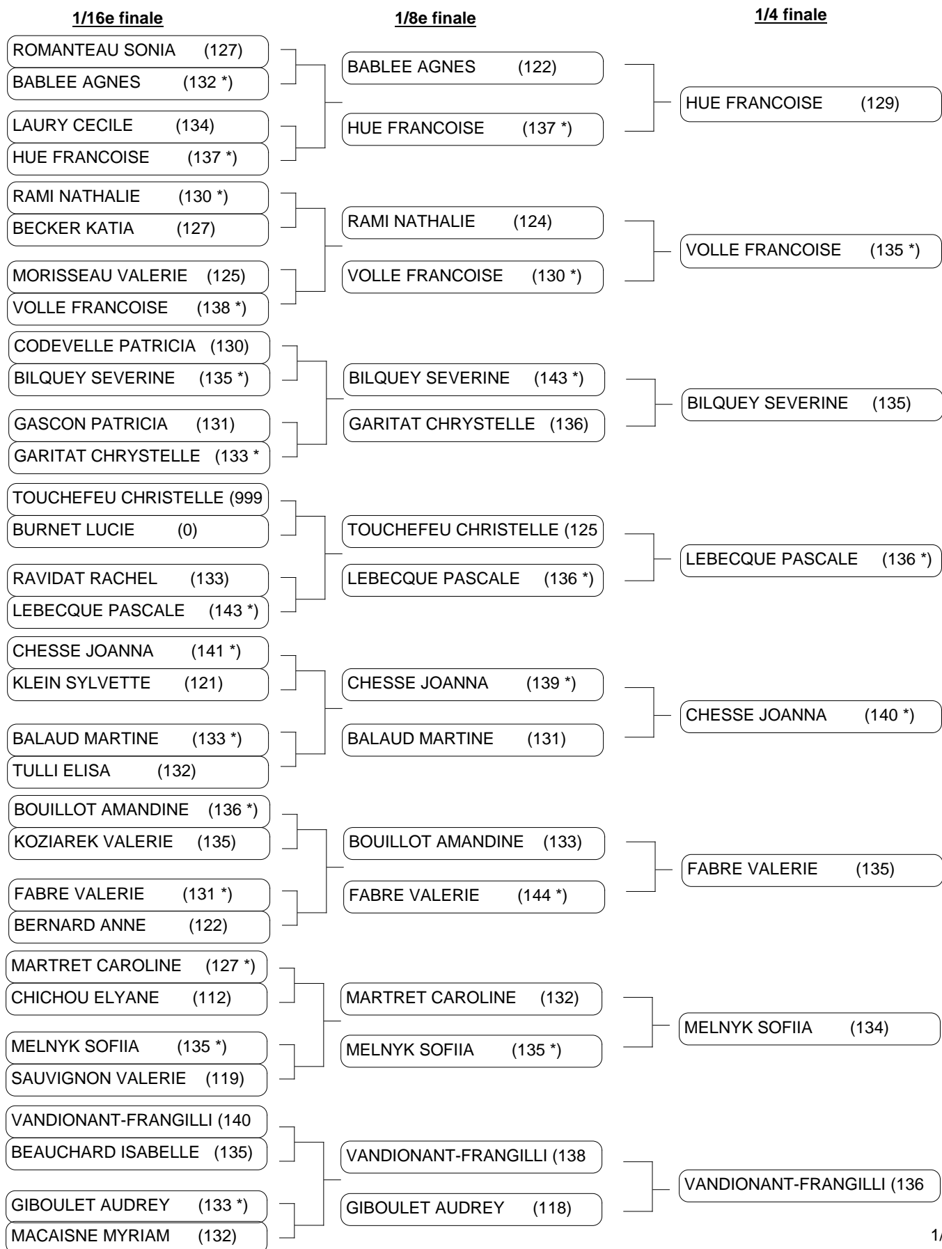
Tableau de matchs SENIORS DAMES ARC A POULIES