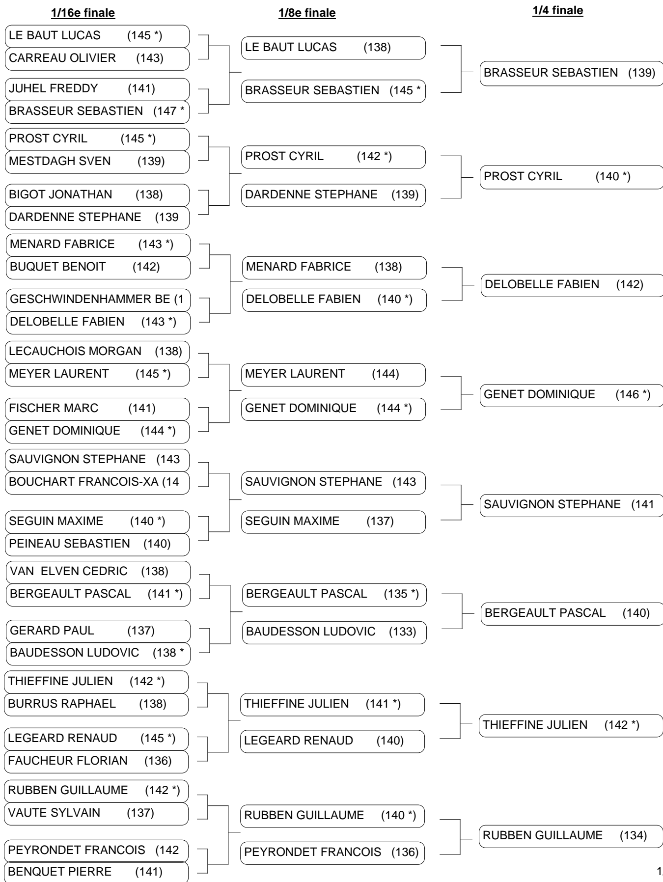
Tableau de matchs SENIORS HOMMES ARC A POULIES